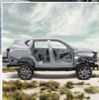
Máxima seguridad Chasis reforzado, 6 airbags, hasta 15 asistencias de seguridad. *version supreme