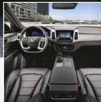
Cabina para 7 pasajeros adultos y centro de entretenimiento de 9"