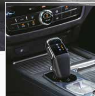
Transmisión electrónica con sistema Shift By Wire con 8 velocidades